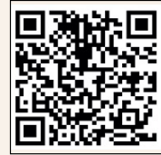
GET IT ON Google Play

QR코드를 카메라로 스캔하거나 구글플레이, 애플 앱스토어 에서 캐슬링 모바일 검색 후 다운로드 받아 설치, 실행합니다.