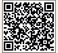
Available on the iPhone App Store